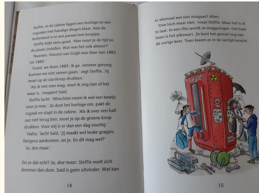
Stoere Steffie (E4) door Annemarie Bon

Aan het eind van de leesles wil ik graag van je weten of jij ook iets spannends bent tegengekomen